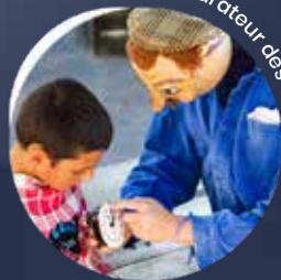
Anatole, réparateur des coeurs