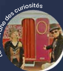
La caravane des curiosités