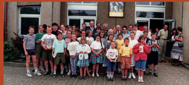
Distribution de prix lors de la Fête de la Musique.