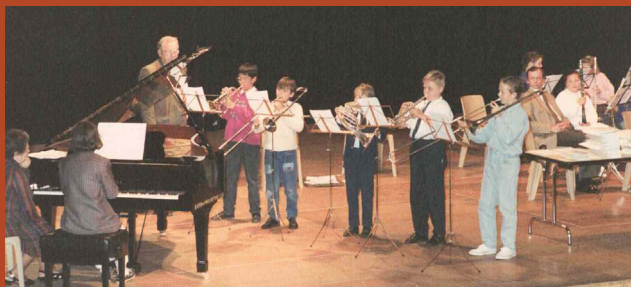
Fête de la Musique en 1993.