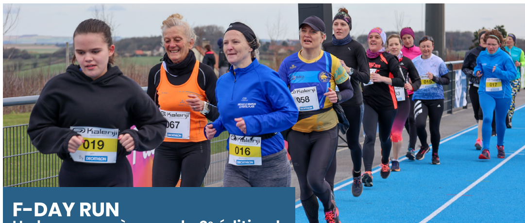
F-DAY RUN Un beau succès pour la 2 e édition !

Dimanche 13 mars signait la 2 e édition de la F-DAY RUN au stade Roland Bellegueulle.