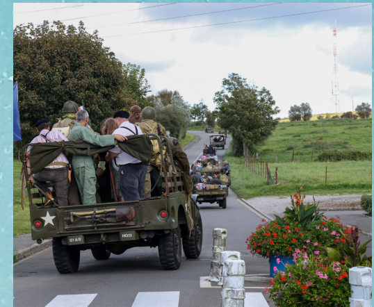
Le samedi, les véhicules militaires ont fait le tour de la ville. Ici, le cortège remontait la Croix-Abot.