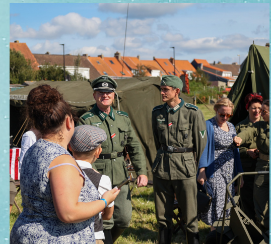
Les visiteurs ont pu découvrir les habits militaires et les conditions dans lesquelles vivaient les soldats.