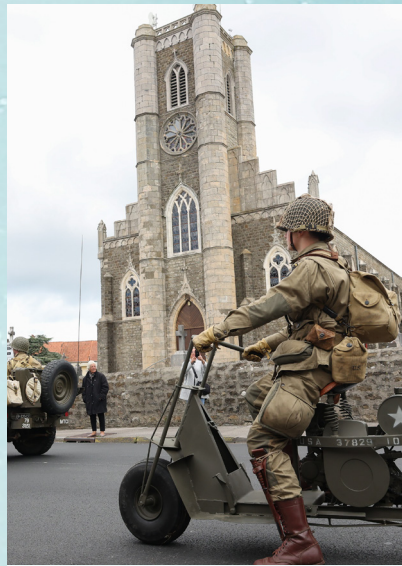
Comme ici route de Desvres, le défilé nous a replongés dans le passé.