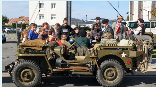
Les enfants, ici à Léon-Blum, sont venus nombreux découvrir les véhicules militaires.

espaces verts Giroux-Sannier avec véhicules de l'époque, tentes, matériels et décors pour rendre compte de la réalité de la guerre... Une exposition était également installée dans le hall de la salle de sport. Deux temps forts ont rythmé ces deux jours : un défilé des véhicules militaires dans la ville le samedi après-midi, et un défilé à pied le dimanche matin jusqu'à la stèle Jean-Moulin.