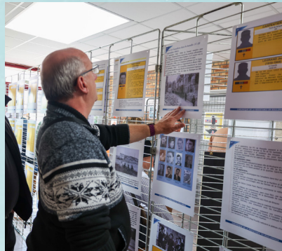
L'exposition avec documents et photos de l'époque a duré tout le week-end.