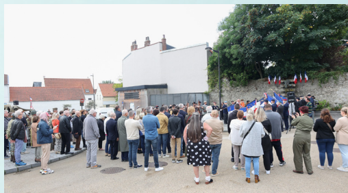
Il y a eu foule, le dimanche matin, place Jean-Moulin pour la cérémonie.