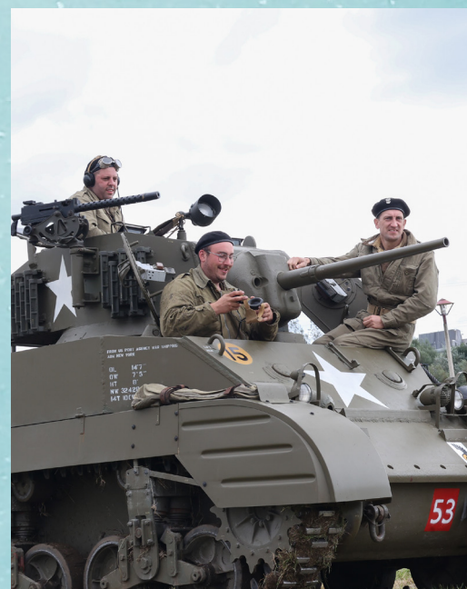
Indéniablement le plus spectaculaire, un char a fait des tours sur les espaces verts.