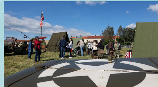
Plusieurs tentes étaient déployées, avec au cœur du camp militaire un drapeau américain hissé.