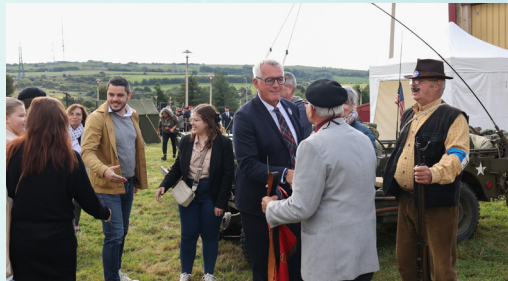
Les élus n'ont pas manqué de féliciter les bénévoles, sur place pendant deux jours entiers.