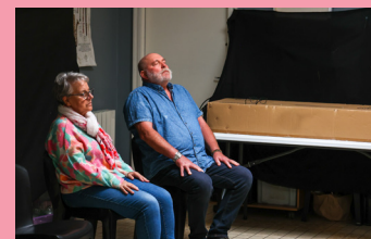
Des séances de sophrologie en partenariat avec l'OF3.