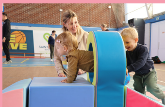
Un atelier parent/enfant pour les 0-3 ans.