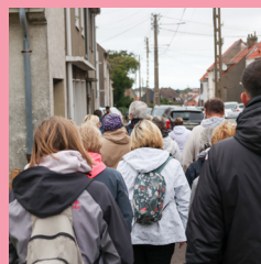
De la randonnée !