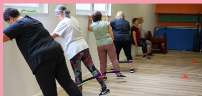
Deux nouvelles séances de sport santé pour un accompagnement plus individualisé.

Programme, fiche d'inscription et questionnaire de santé à retrouver sur notre site www.saintmartinboulogne.fr dans l'onglet Activités sportives