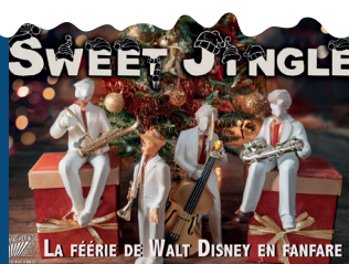
SAMEDI 7 À 15H30 ET 17H SWEET JINGLE

L'univers de Disney et de Noël ravivé par cette fanfare haute en couleurs