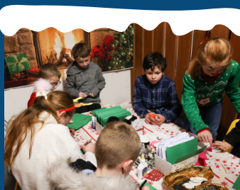
VENDREDI 6 DE 17H30 À 20H30 SAMEDI 7 DE 14H À 19H DIMANCHE 8 DE 14H À 19H L'ATELIER DES LUTINS

Les danseuses Snow illuminent la nuit de la ville comme jamais auparavant