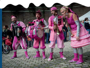
DIMANCHE 8 À 14H30, 16H ET 17H30 DOUBLEVÉDÉ QUINTET

L'univers de Disney et de Noël ravivé par cette fanfare haute en couleurs