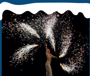
VENDREDI 6 À 19H30 ENFLAMMÉES

Jonglerie et danse se marient sous une pluie de flammes et d'artifices