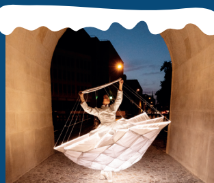
SAMEDI 7 À 15H, 17H30 ET 18H30 LES BOULES DE NEIGE

Jonglerie et danse se marient sous une pluie de flammes et d'artifices